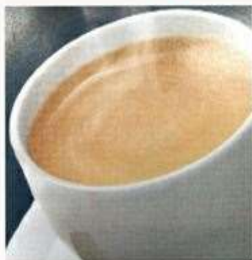
ホットコーヒー 400円