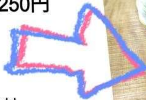
牧場牛乳ソフト 250円